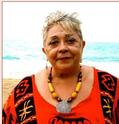
Dylcia Noemí Pagán militante de las FALN