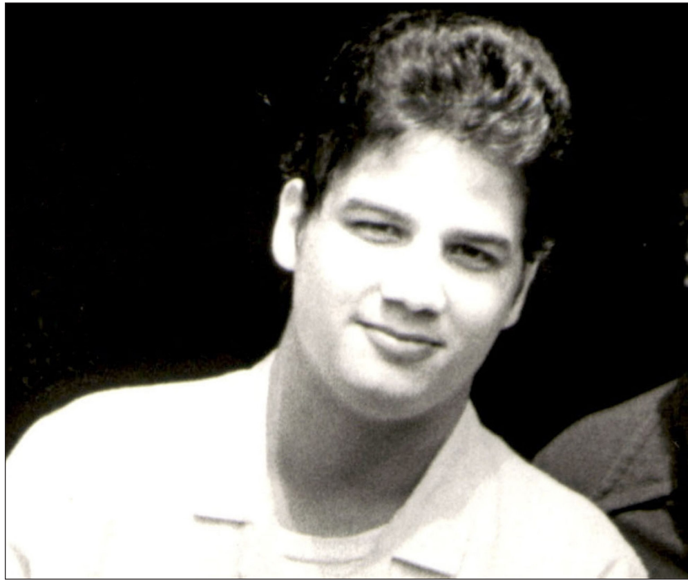
Foto del asesino en serie Ángel Colón Maldonado, "El Ángel de los Solteros"