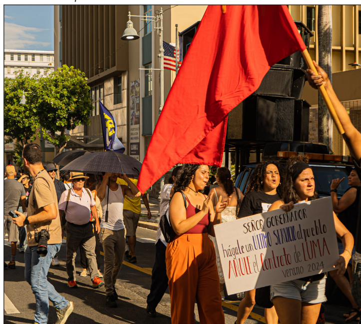
Protesta del MST frente a las oficinas de la AEE y Luma Energy ante los apagones de julio y el pésimo servicio eléctrico.