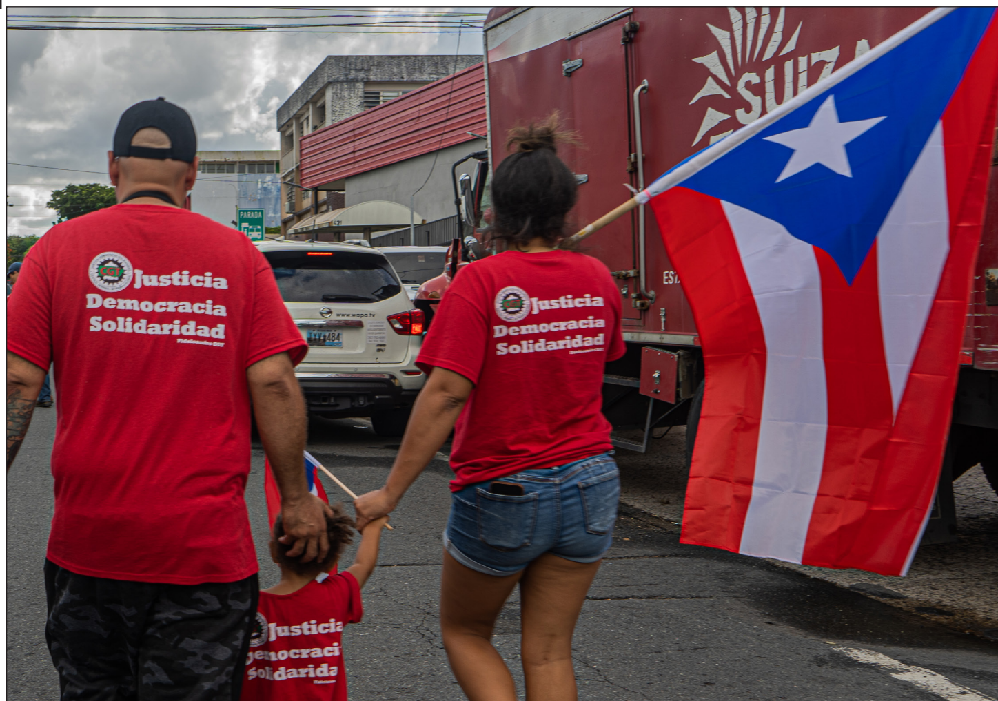
Familia de trabajadores en huelga en lucha por un convenio justo.