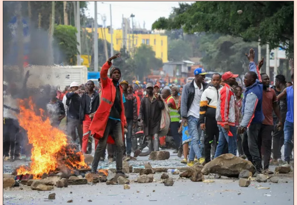
Manifestantes ocupan las calles en Kenia rechazando la imposición de nuevos impuestos